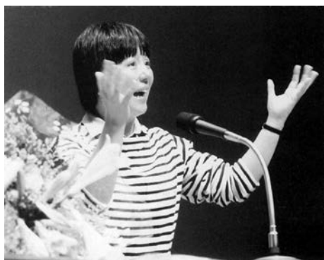
身ぶり手ぶりの大熱演に聴衆も魅了されて