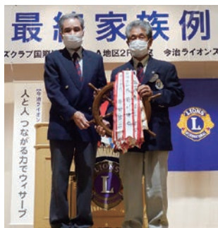
プレジデントキーの引き渡し