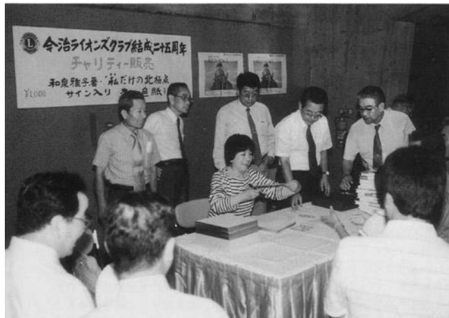
事業資金獲得アクティビティ