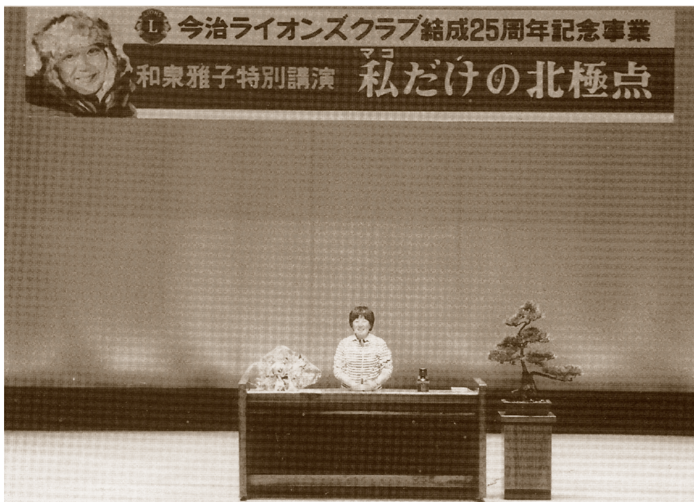
今治ライオンズクラブ結成25周年記念事業「和泉雅子特別講演」『 マコ 私だけの北極点』