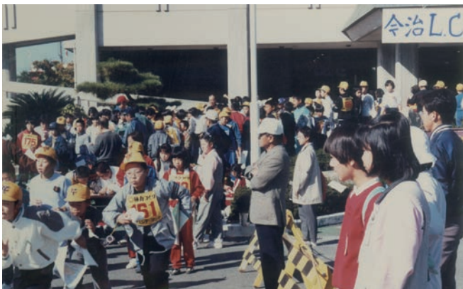
サア!! スタートダッシュ