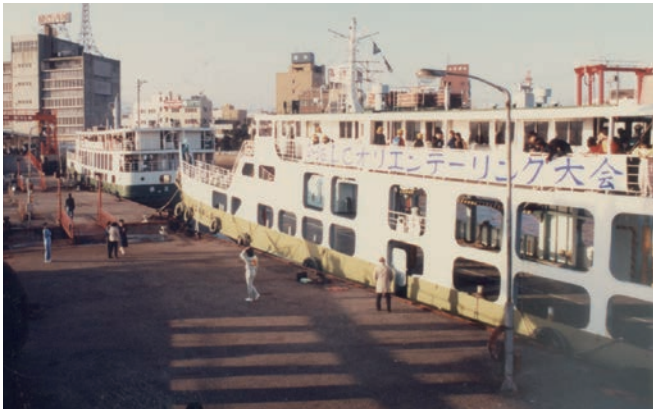
フェリーに乗込み会場へ