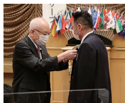
地区ガバナーよりバッジの贈呈