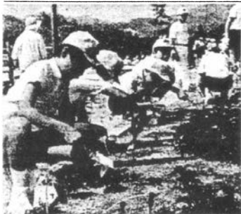
今治ライオンズクラブの「花いっぱい運動」に協力し、ヒマワリの苗を植える地元乃万小の児童たち

びっしりの児童たちは「約られるのが楽しみです」と話 一カ月半には大輪の花が見ていた。