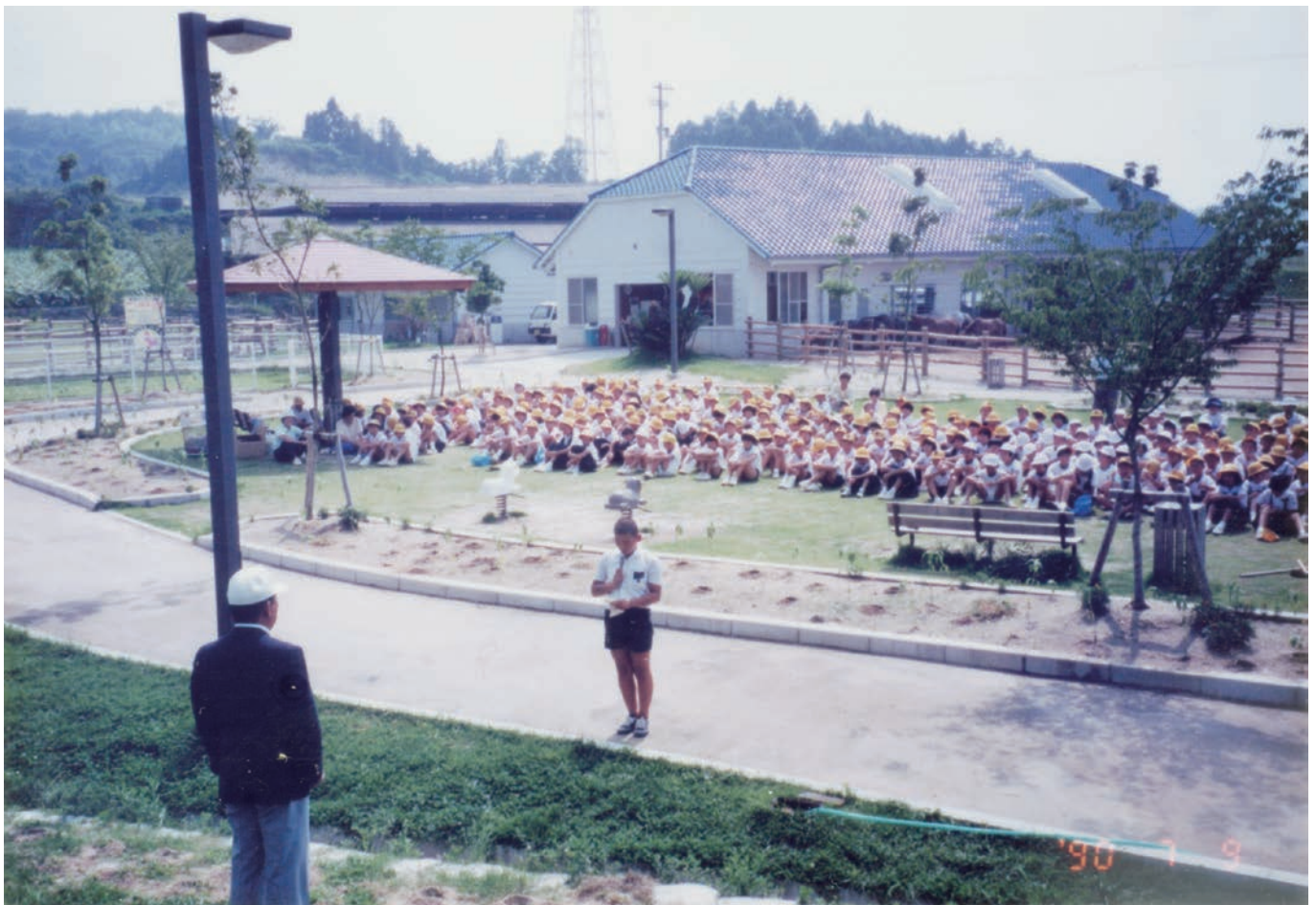
1990年～1991年 メインアクティビティ 野間馬ハイランドにひまわりの定植

ライオンズクラブ国際協会 336-A地区2R,2Z 10/2021 No.533