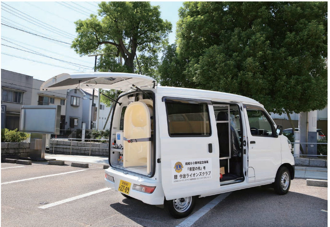
今治ライオンズクラブ結成60周年記念事業 今治市社会福祉協議会へ『希望の光』号（訪問入浴車両）贈呈

ライオンズクラブ国際協会 336-A地区2R,2Z 11/2021 No.534