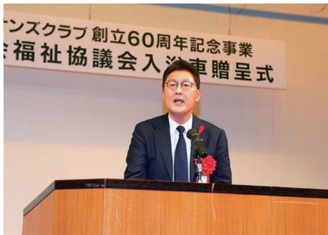
徳永繁樹 今治市長