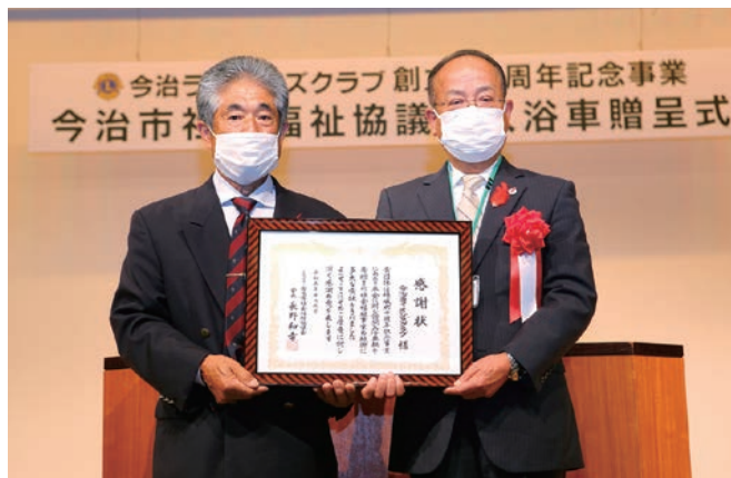
今治市社会福祉協議会より感謝状授与