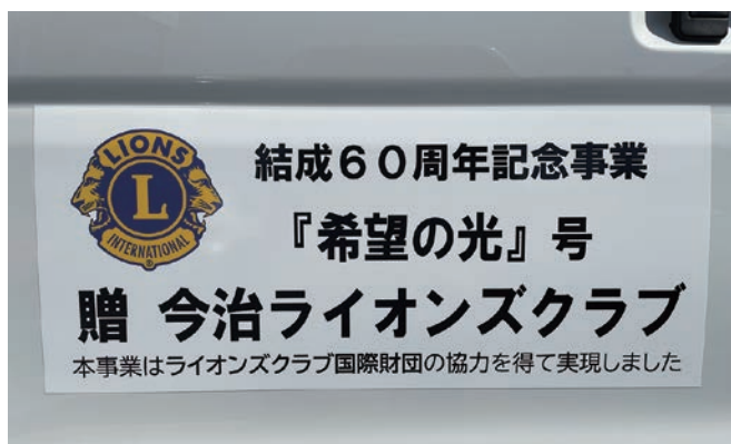
ライオンズクラブ国際財団より クラブシェアリング交付金3,840US$ 活用