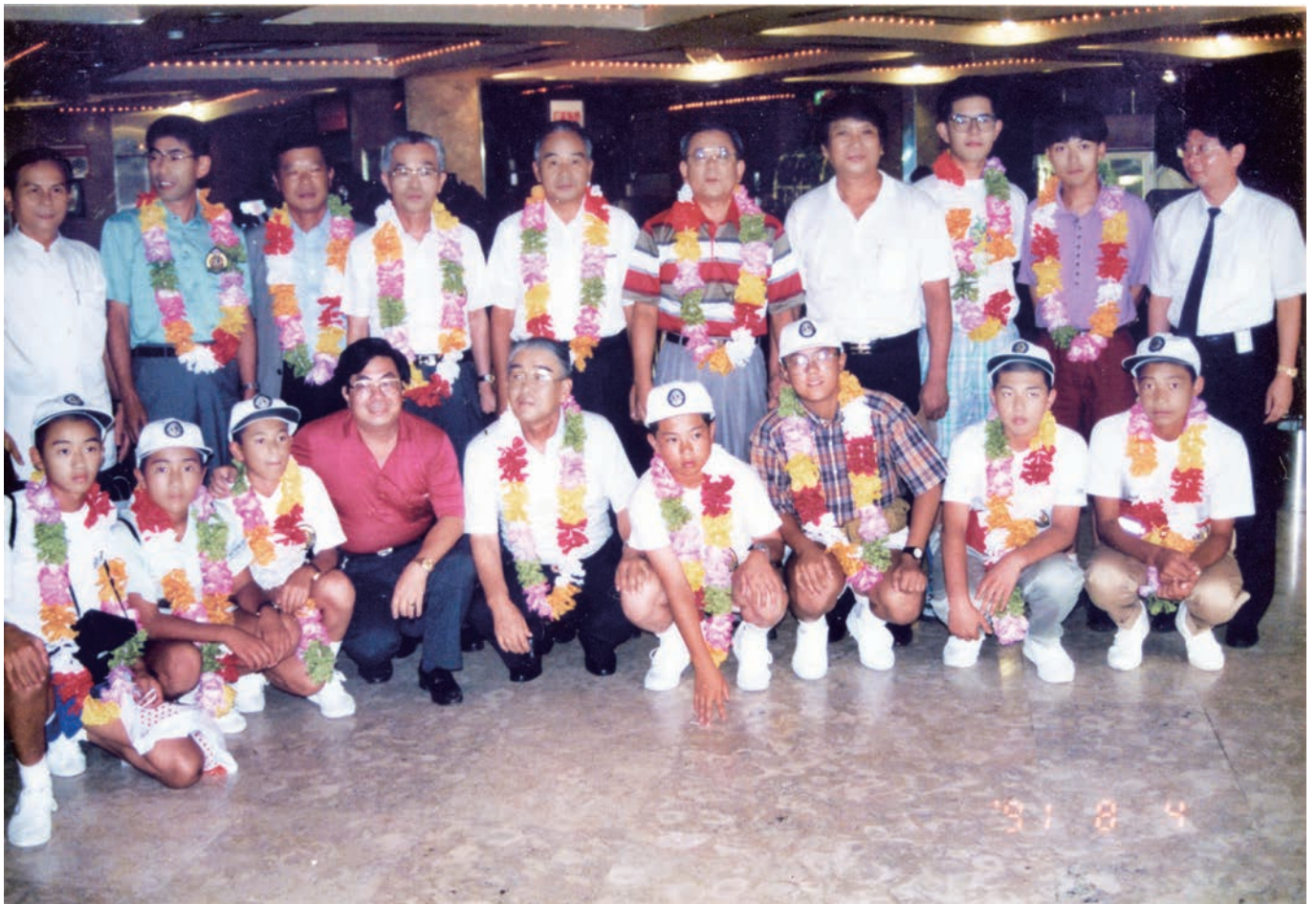
1991年 今治ライオンズクラブ結成30周年記念事業 『今治市中学生海外ホームステイ・研修旅行』台湾・嘉義市

ライオンズクラブ国際協会 336-A地区2R,2Z 12/2021 No.535