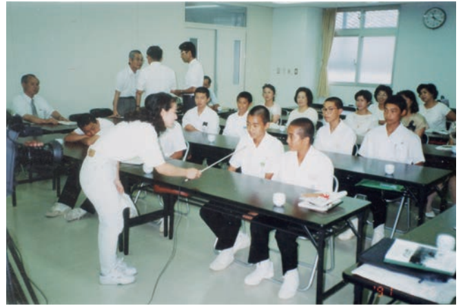
ホームステイオリエンテーション