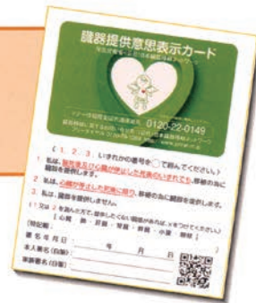
臓器提供 意思表示カード

亡くなられたときに日本臓器移植ネットワークが発行している臓器提供意思表示カードや眼球提供意思表示をした健康保険証や運転免許証を所持している場合でも提供は可能です。