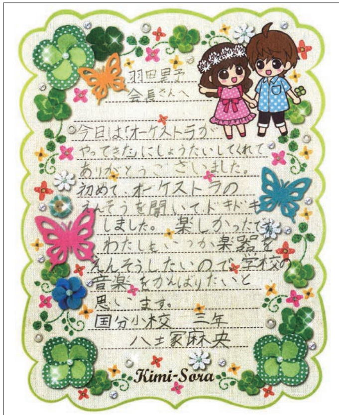
小学校当時の手紙